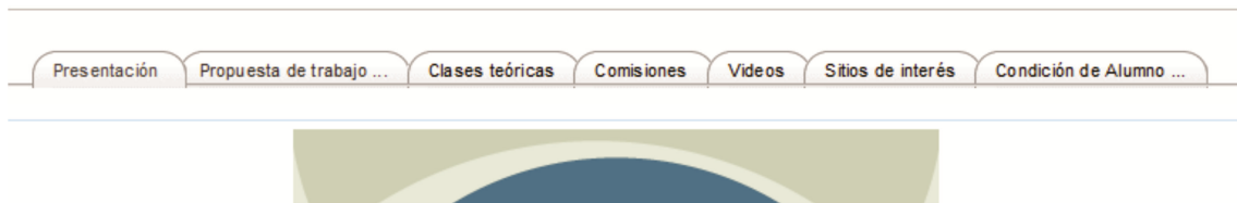
Imagen 1: Formato “Temas en Pestaña”

En caso de que nuestra aula esté configurada en “Pestañas” y deseemos cambiarla a “Temas”, debemos seguir estos pasos: